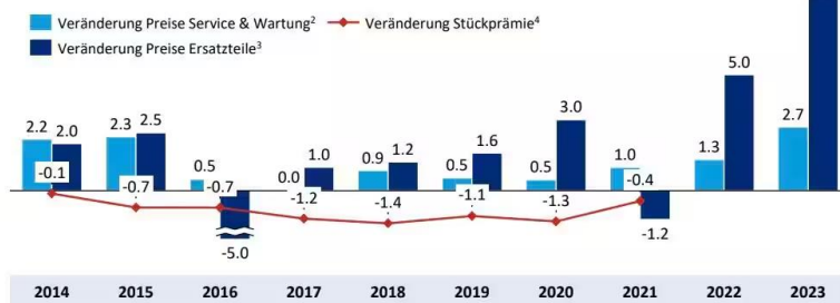
Entwicklung der Kosten für Service & Wartung und Ersatzteile sowie der durchschnittlichen Prämie Year on Year 2014 - 2023 1 in % gegenüber dem Vorjahr